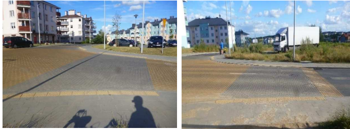
Skrzyżowanie Srebrna - Kolorowa

Jakie są dobre praktyki stosowania sugerowanych przejść dla pieszych w Gdańsku?