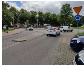
Skrzyżowanie Bema - Zakopiańska

Jakie są dobre praktyki stosowania sugerowanych przejeżd dla pieszych w Gdańsku?