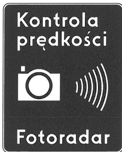
Rys. 5.2.56.1. Znak D-51

Znak D-51 „automatyczna kontrola prędkości” (rys. 5.2.56.1.) stosuje się w celu poinformowania kierujących pojazdami o lokalizacji urządzeń działających samoczynnie, kontrolujących i rejestrujących prędkość ruchu pojazdów.